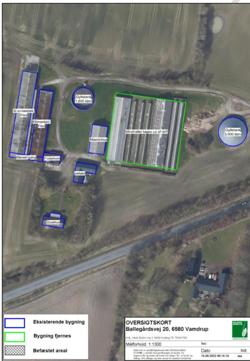
Figur 1. Situationsplan over anlægget.

Ændringen sker i eksisterende anlæg. Den eksisterende minkproduktion nedlægges, og hallerne fjernes.