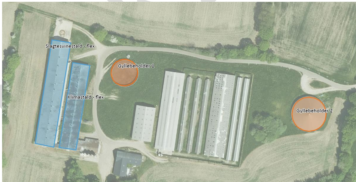
Figur 2. Oversigtskort over produktionsarealer (blå) og gødningsopbevaringsanlæg (orange) på Ballegårdsvej 20, Vamdrup